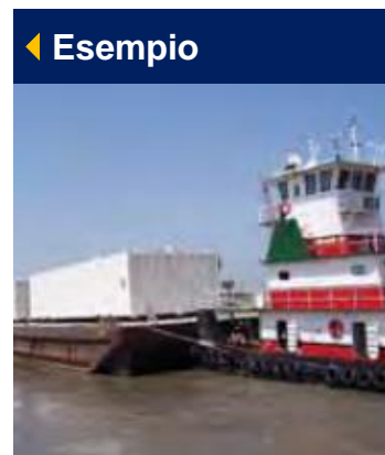
Chart apprezza l'opportunità di integrarsi nelle comunità locali e si preoccupa del suo possibile impatto sulle stesse. Chart condivide il rispetto per l'ambiente e osserva gli obblighi specificati dalle leggi e dai regolamenti ambientali. Ci impegniamo dunque a ridurre il nostro impatto ambientale ogni qualvolta sia economicamente fattibile.

A causa del boicottaggio imposto dalla Lega Araba su Israele, le lettere di credito emesse da banche in Medio Oriente impongono che nessuna parte dei beni acquistati sia prodotta in Israele o trasportata su navi israeliane. La legge degli Stati Uniti vieta l'osservanza di tali requisiti.